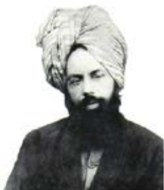
Mirza Ghulam Ahmad (1835-1908)

La Comunidad Musulmana Ahmadía fue fundada en 1889 por Hazrat Mirza Ghulam Ahmad (1835-1908) quien afirmó ser el Reformador esperado de los Últimos días, el Esperado por todas las comunidades religiosas del mundo (el Mahdi y el Mesías). La Comunidad que inició es un compendio del mensaje conciliador del Islam: paz, hermandad universal y sumisión a la Voluntad de Dios, en su pureza original. Hazrat Ahmad declaró que el Islam era la religión del hombre: “La religión de la gente del camino recto” (98:6)