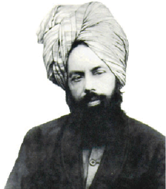
Mirza Ghulam Ahmad (1835-1908)

El Movimiento Ahmadía del Islam fue fundado en 1889 por Hazrat Mirza Ghulam Ahmad (1835-1908) quien afirmó ser el Reformador esperado de los Últimos días, el Esperado por todas las comunidades religiosas del mundo (el Mahdi y el Mesías). El Movimiento que inició es un compendio del mensaje conciliador del Islam: paz, hermandad universal y sumisión a la Voluntad de Dios, en su pureza original. Hazrat Ahmad declaró que el Islam era la religión del hombre: “La religión de la gente del camino recto” (98:6)