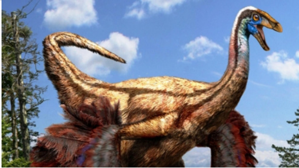
Por Tariq Abdul Ghalib (Córdoba)

ڈرم بیلر (البرٹا) کے رائل ٹائرل میوزیم کے کیوریٹر اور جائزے کے معاون مصنف فرانکونس تھیرائین نے کہا کہ اس دریافت سے ایک اور حیرت انگیز حقیقت سامنے آئی ہے کہ قدیم زمانے میں پروں والے ایسے طویل القامت پرندے پائے جاتے تھے جو اڑ سکتے تھے