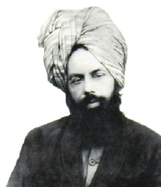
Mirza Ghulam Ahmad (1835-1908)

El Movimiento Ahmadía del Islam fue fundado en 1889 por Hazrat Mirza Ghulam Ahmad (1835-1908) quien afirmó ser el Reformador esperado de los Últimos días, el Esperado por todas las comunidades religiosas del mundo (el Mahdi y el Mesías). El Movimiento que inició es un compendio del mensaje conciliador del Islam: paz, hermandad universal y sumisión a la Voluntad de Dios, en su pureza original. Hazrat Ahmad declaró que el Islam era la religión del hombre: “La religión de la gente del camino recto” (98:6)