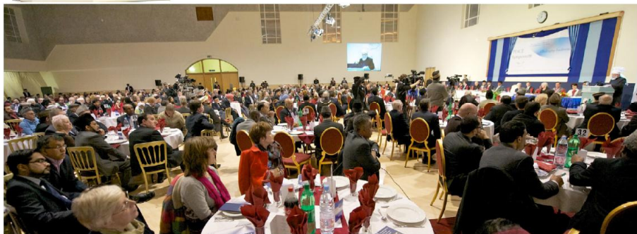
SIMPOSIO SOBRE LA PAZ. AÑO 2010

Se plantea la siguiente pregunta: Si estos Maestros eran todos de Dios ¿por qué diferían tanto en cuanto a sus enseñanzas? ¿Acaso Dios enseñaría principios distintos en épocas distintas? Incluso los mortales intentamos ser consecuentes y enseñar los mismos principios en épocas distintas. La respuesta a esta pregunta es que mientras las condiciones se mantengan iguales, sería absurdo dar instrucciones distintas. Pero cuando cambian las condiciones, la variación de la enseñanza representa la esencia de la sabiduría. En tiempos del Profeta Adán, parece que los hombres vivían juntos en una parte del mundo; por lo tanto, les bastaba una sola enseñanza. Es posible que incluso hasta los tiempos de Noé continuaran viviendo juntos de esta manera. Según la Biblia, las tribus humanas continuaron viviendo juntas en una sola parte del mundo hasta la época babilónica. La Biblia no es un libro de historia; pero existen pruebas que confirman la versión bíblica.