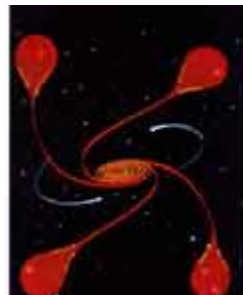
Ilustración 1: El Agujero negro final

21:105 يَوْمَ نَطْوِي السَّمَاءَ كَطَيِّ السِّجِلِ لِلْكِتَابِ