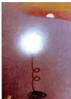
Ilustración 2: El Universo Emergente

“... Al igual que empezamos la primera creación, la repetiremos; una promesa que nos obliga : en verdad la cumpliremos.”